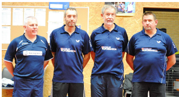
Equipe Première évoluant en Régionale 3

7 équipes engagées en championnat régional et départemental. 3 équipes engagées en Coupe de la Manche. Un joueur inscrit au Critérium Fédéral Régional.